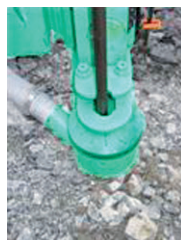
Lunette avant ouvrante, manuelle